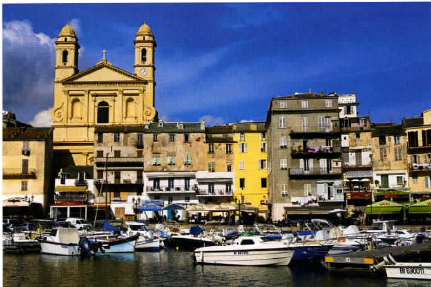
La vue sans doute la plus pittoresque de Bastia : le vieux port dominé par l'église Saint-Jean-Baptiste, la plus grande église de Corse.

Plus loin, à Levie Mano Liska, un remarquable artisan œuvre dans une coutellerie créative, opportunément nommée Alt'art. A Levie se situe par ailleurs l'une des étapes favorites de notre voyage : la ferme-auberge "A Pignata". Près du castel préhistorique de Cucurruzu et des ruines médiévales de Capula, cet établissement en pleine nature constitue une alternative intéressante au "tout camping-car". Ensuite, par la route de l'Ospedale, puis celle de Porto-Vecchio (station balnéaire la plus fréquentée de Corse), nous mettons le cap sur Bonifacio. Divisée en trois parties, la ville haute, la marine et les alentours, Bonifacio surplombe admirablement des falaises calcaires d'une soixantaine de mètres de hauteur ! Une splendeur... Sans oublier, plus au large, le sanctuaire des îles Lavezzi. Pour achever ce circuit, nous choisissons Ajaccio en passant par Sartène, autre bastion de la "Corsitude", puis Filitosa, un important site mégalithique. A Ajaccio, 250 ans après sa naissance, le souvenir de Napoléon Bonaparte perdure. De nos jours, c'est une ville belle et plaisante, avec son marché, notamment le dimanche matin. Ce lieu haut en couleurs et fragrances est une vitrine des savoureux produits du terroir corse ; charcuterie, fromage, fruits et vins. Un pur régal ! Sans oublier le port de pêche, des musées, des plages intra-muros et les îles Sanguinaires. Enfin, à 15 km, la plage de Porticcio offre une délicieuse conclusion à ce voyage sur « l'île de la Très Grande Diversité ».