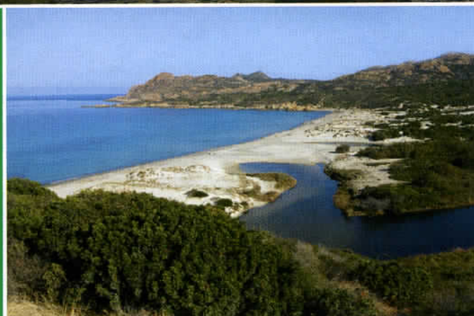
Saisissant paysage abandonné au maquis, le littoral des Agriates se découvre idéalement à pied.