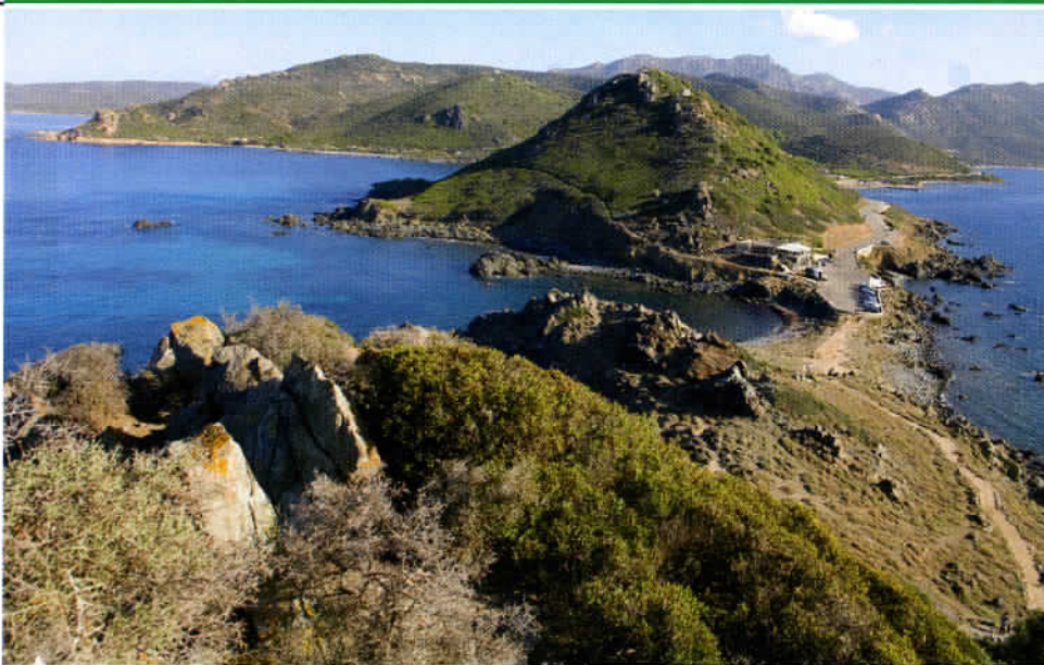
Depuis la pointe de la Parata (15 mn de marche) se découvre une superbe vue sur les îles Sanguinaires. A faire au couchant, de préférence.