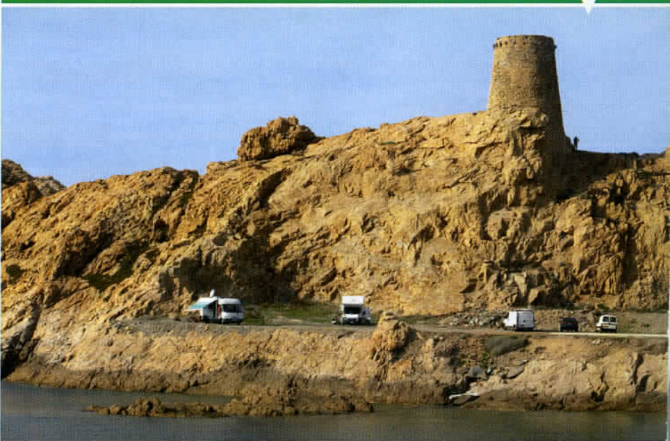
Entre l'île Rousse et Calvi, quelques parkings de bord de mer peuvent accueillir les camping-cars pour une courte étape.